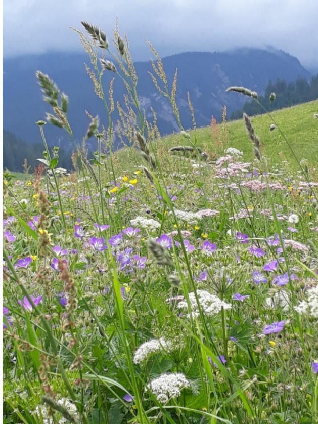
(Farbenspiel der Natur)

Wer mit Achtsamkeit durch den Wald spazieren geht, fühlt wie wichtig dieses Ökosystem für uns ist. Vom Vogelgezwitscher, bis hin zu Farben und Bildern die uns beeindrucken, der Wald ist eine kostbare Naturlandschaft, die uns am Herzen liegt.