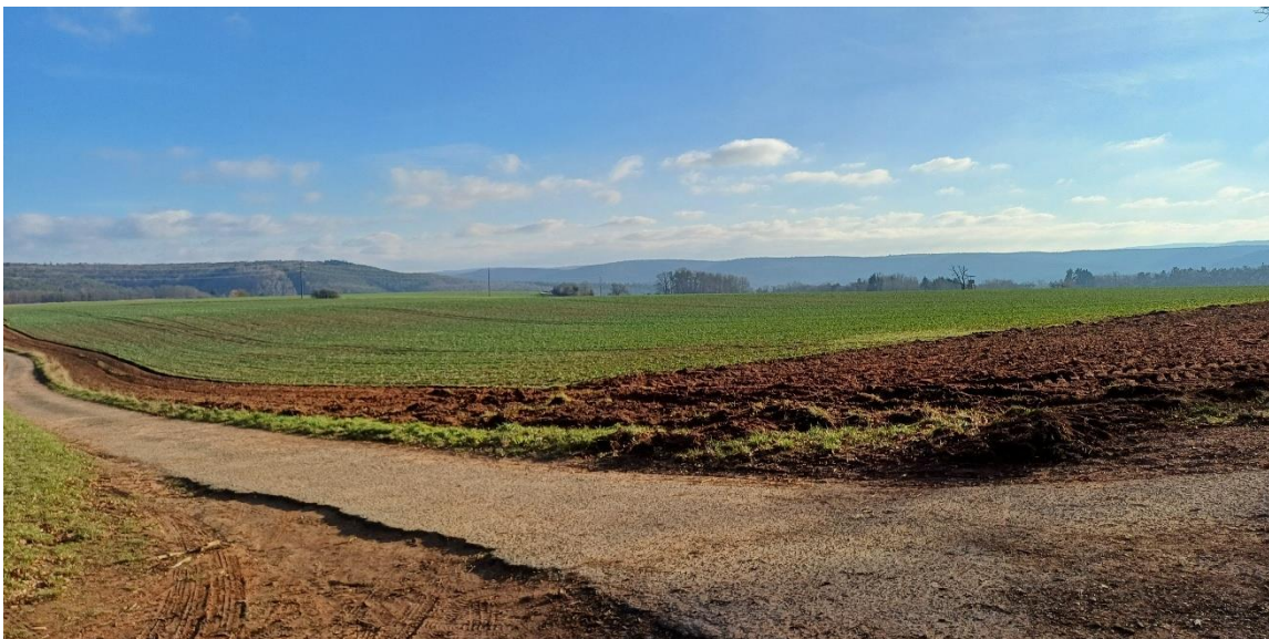
(Landwirtschaftliche Flächen in der Nähe der A8, innerhalb des Biosphärenreservates Pfälzerwald)

Klar ist, Windräder können nicht überall gebaut werden, aber große Flächen pauschal für die Windkraft auszuschließen, erschwert den Ausbau erheblich.