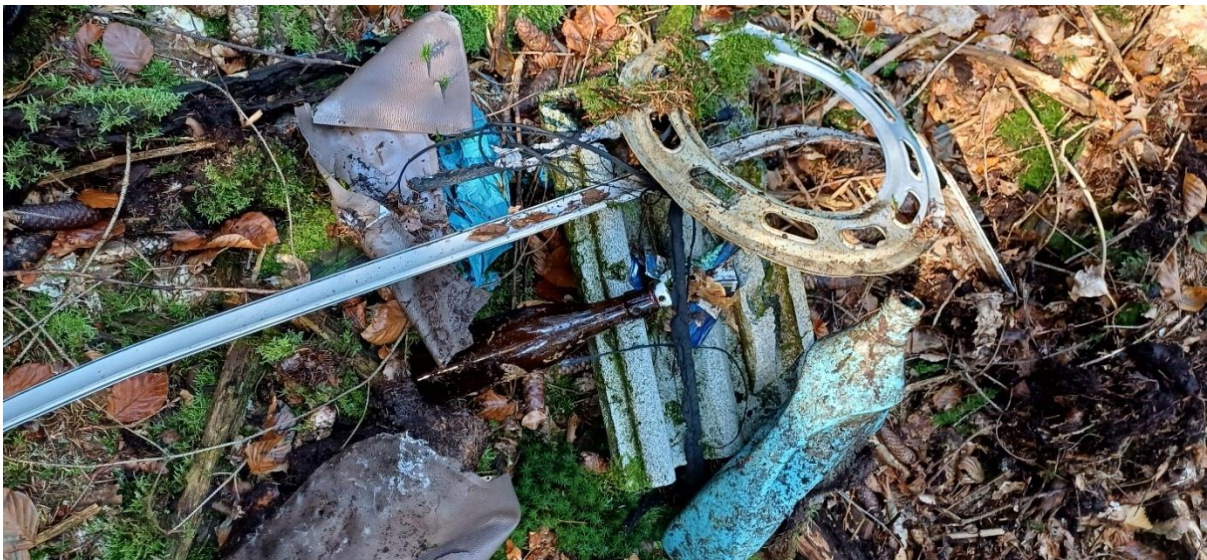
(Weggeworfener Müll im Biosphärenreservat Pfälzerwald, unterhalb der B48)

Das Problem der knappen Wertstoffe, ist neben dem Klimawandel und anderen existenziellen Problemen, ein weiteres fundamentales Problem. Derzeit gehen zu viele Wertstoffe dauerhaft verloren. Hier ist die Politik, die Wirtschaft und die Gesellschaft, gleichermaßen gefordert.